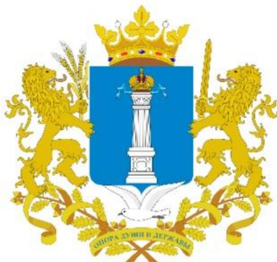
Герб Ульяновской области